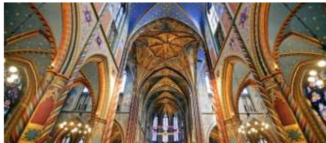
Gewölbe der Marienbasilika Kevelaer