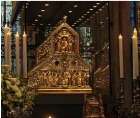
Dreikönigsschrein im Kölner Dom